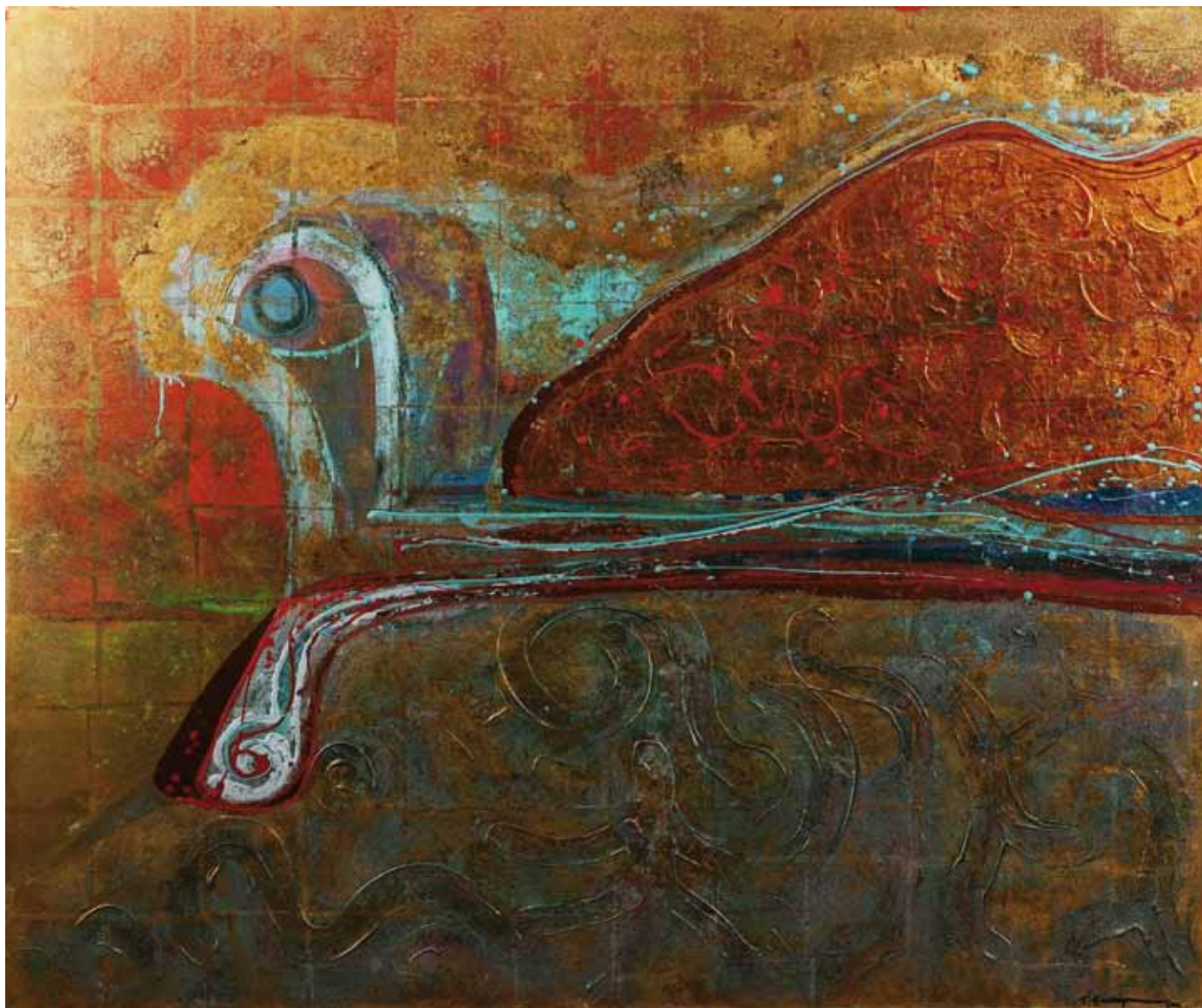
DÍALOGOS 150 X 180 CM Técnica: hoja de oro sobre tela