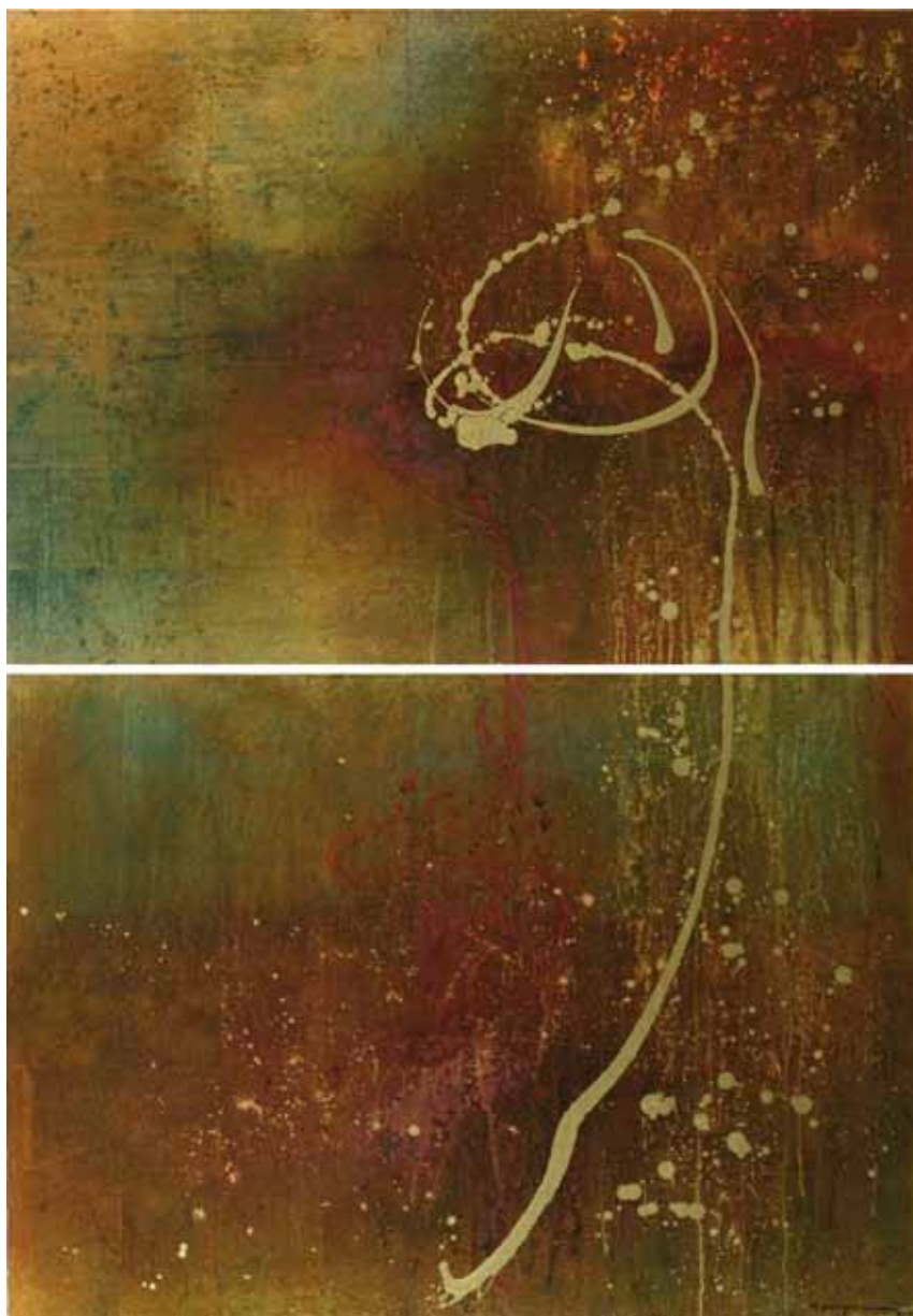
TRANSMUTACIÓN 200 X 140 CM (díptico)

Su obra se caracteriza por un amplio manejo de los metales y un conocimiento de patinas e interesantes reacciones químicas, que le han permitido desarrollar una rica y única paleta de colores y texturas con materiales tales como la hoja de oro, la plata, el aluminio, el cobre, el bronce y el latón; los que, en su manejo y transformación, constituyen lo que bien podríamos llamar: "una propuesta de Alquimia para el siglo XXI".