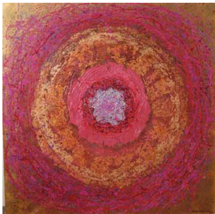
BIO ESFERA 150 X 150 CM Técnica: hoja de oro sobre tela

“...de los materiales y de su técnica científica aplicada, Montoya abraza la tradición del expresionismo abstracto, apoyándose en el uso en el uso de la luminosidad y del contraste de color, con el tema de la naturaleza y el paisajismo en el lenguaje de la metáfora y el símbolo; sin embargo, la construcción de estos elementos también inquietan al observador. El poder de la imagen evoca las emociones del observador y estimula el pensamiento contemplativo y controvertido.”