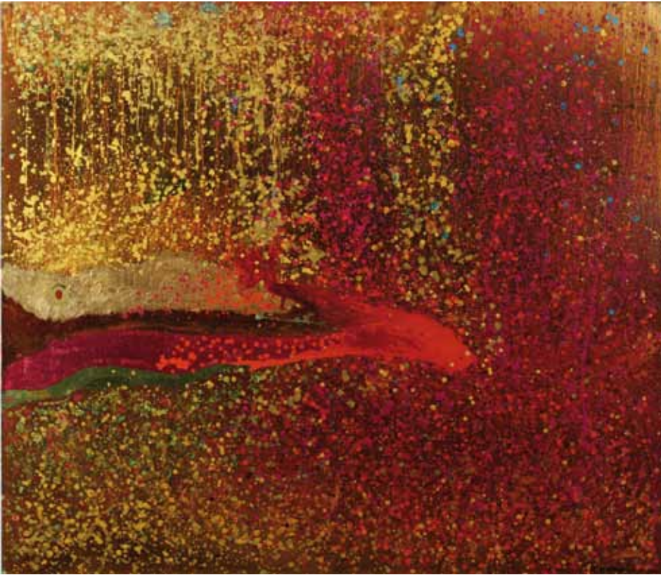
AZUL PROFUNDO 130 X 150 CM Técnica: hoja de oro sobre tela