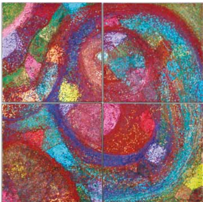
QUETZAL 300 X 300 CM Técnica: hoja de oro sobre tela