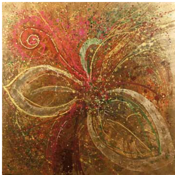
BIO DIVERSIDAD 150 X 150 CM Técnica: hoja de oro sobre tela